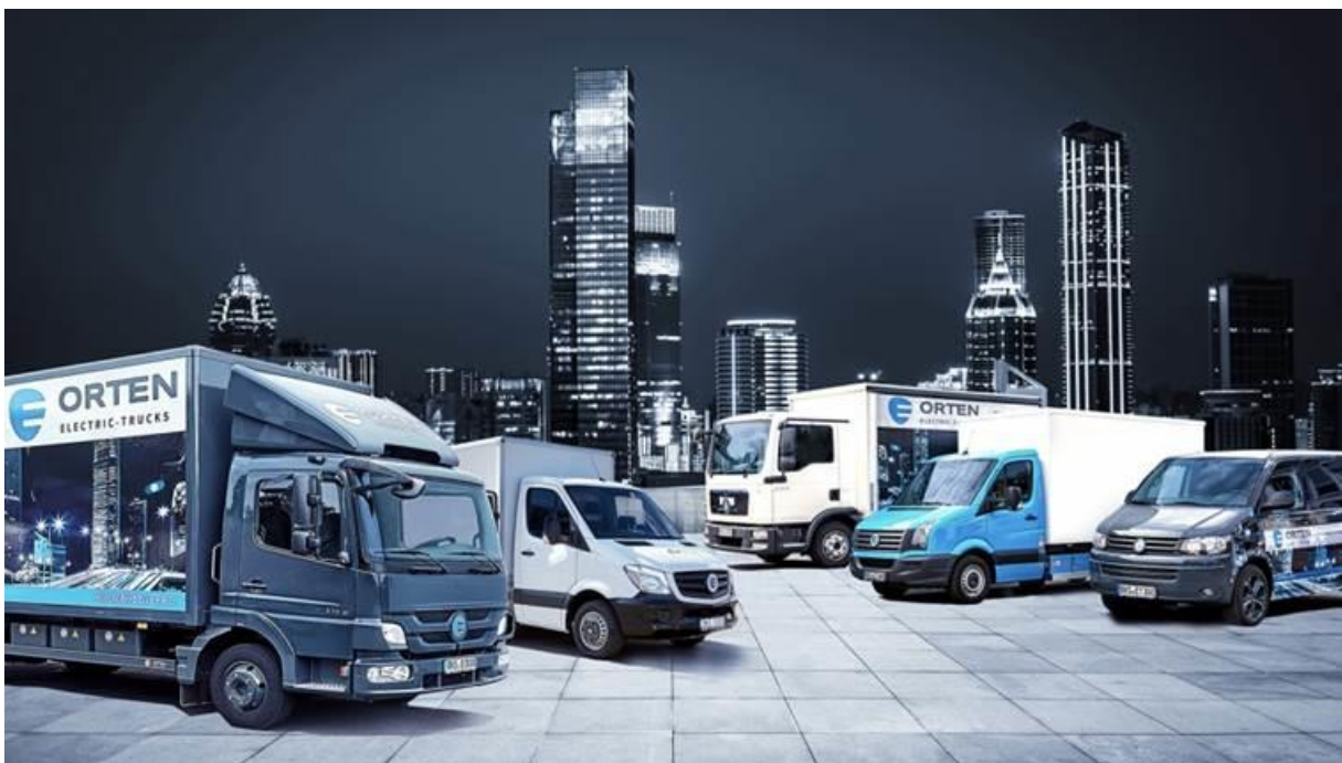
Abb. zeigt: E 75 AT, ET 35 M, E 75 TL, ET 35 V, ET 30 V v.l.n.r.

Fotomaterial finden Sie im Anhang und zusätzlich hier: